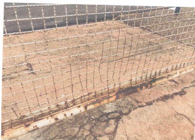
Portão Atual da entrada