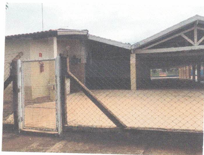
Entrada Atual sem cobertura e portão desgastado devido o tempo de uso