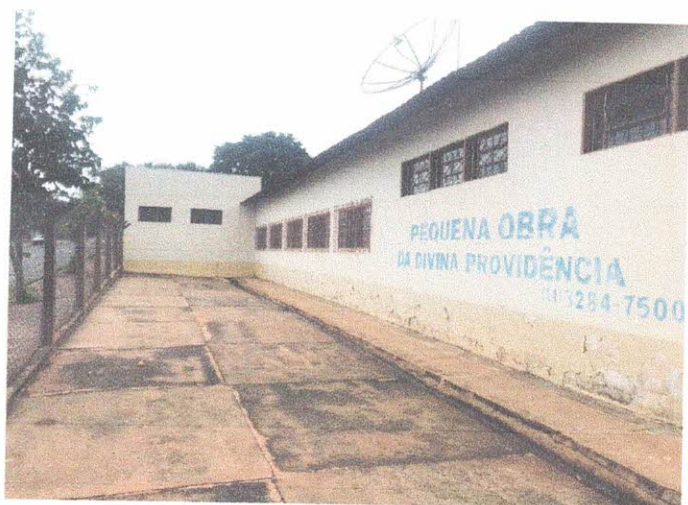
Local onde será a nova entrada das crianças com área coberta.