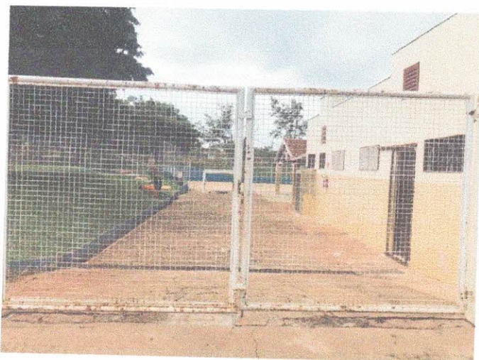
Entrada Atual para carga e descarga bem como para entrada de crianças.