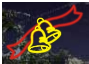
Painel iluminado em forma de sinos duplos transpassados por uma fita