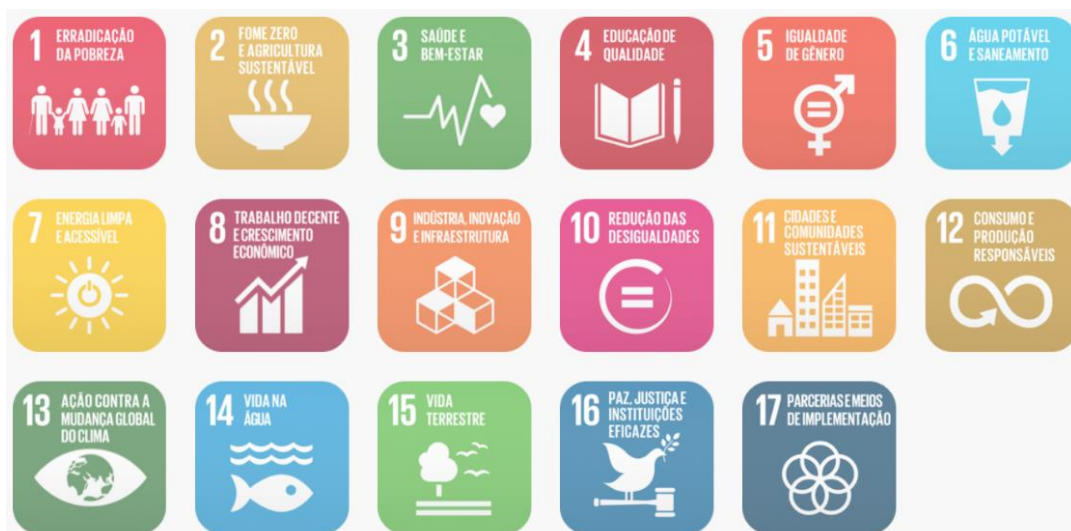
Figura 02: Objetivos de Desenvolvimento Sustentável

Em fortalecimento aos compromissos firmados pelo governo federal junto a ONU que fazem parte dos Objetivos de Desenvolvimento Sustentável – ODS, articulados através da agenda 2030, este projeto promove a utilização de estratégias para construção de edificações sustentáveis, como forma de garantir a sua resiliência e adaptabilidade em meio às mudanças climáticas. Sendo assim o mesmo foi desenvolvido com a utilização de sistemas construtivos capazes de contribuir para a preservação e conservação do meio ambiente, diminuindo o uso e o esgotamento dos recursos naturais, a produção de resíduos e o consumo de energia.