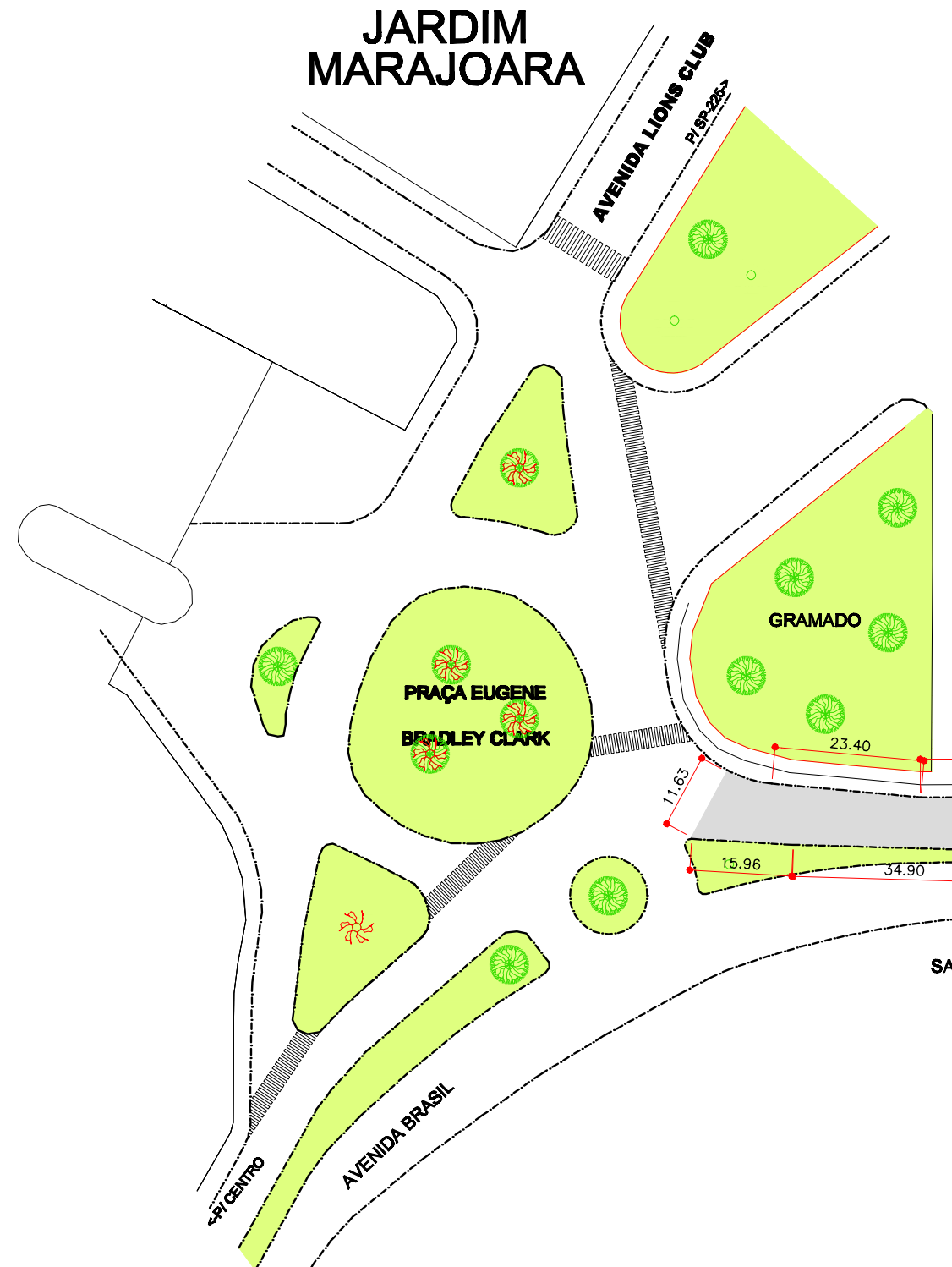
PLANTA ESC. 1:1000