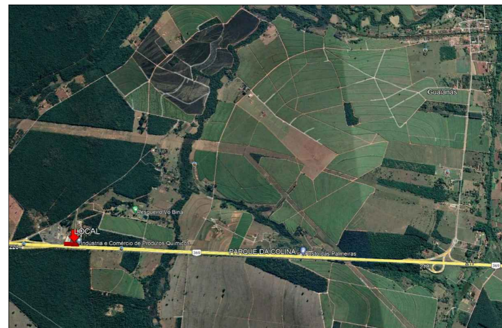
LOCALIZAÇÃO SEM ESCALA