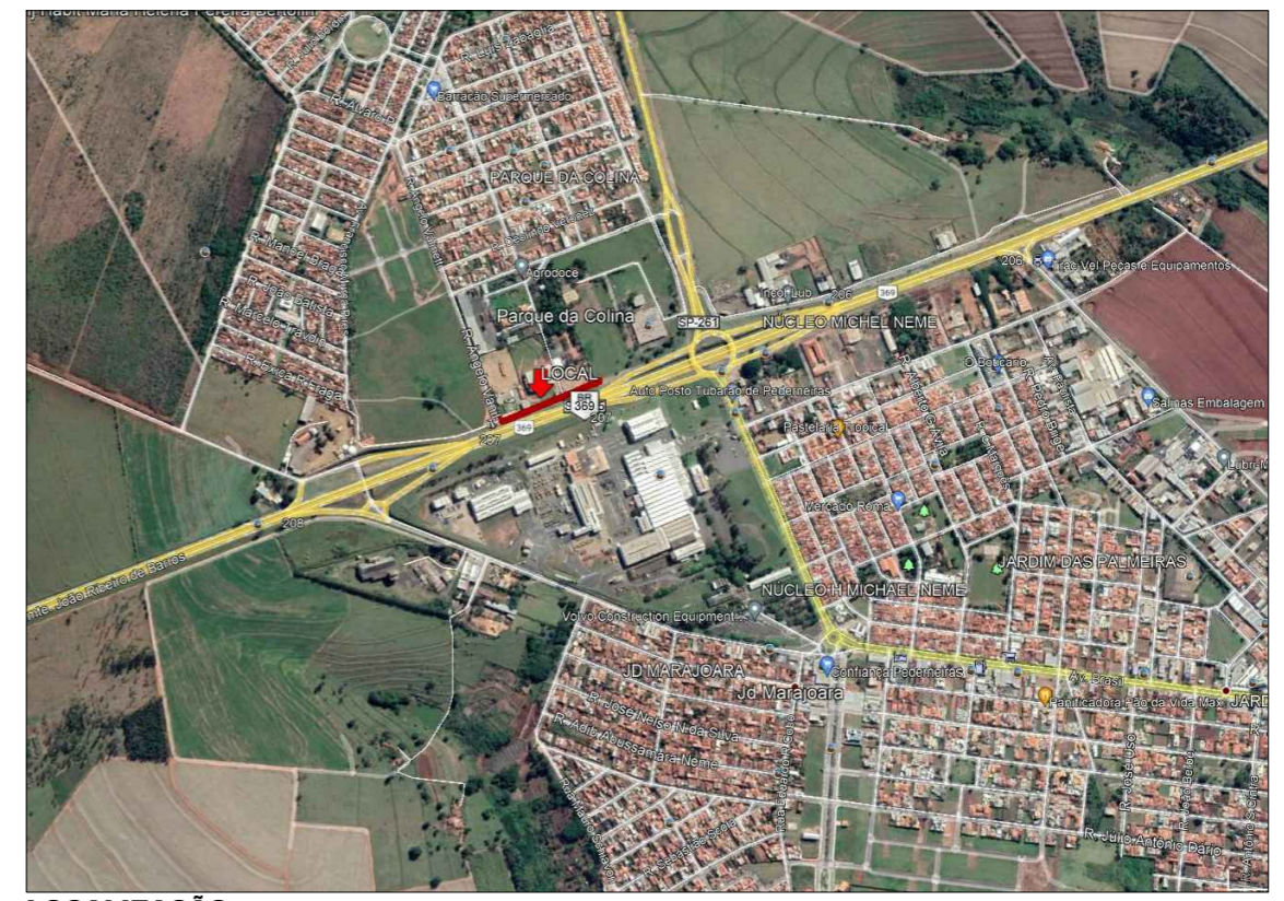
LOCALIZAÇÃO SEM ESCALA