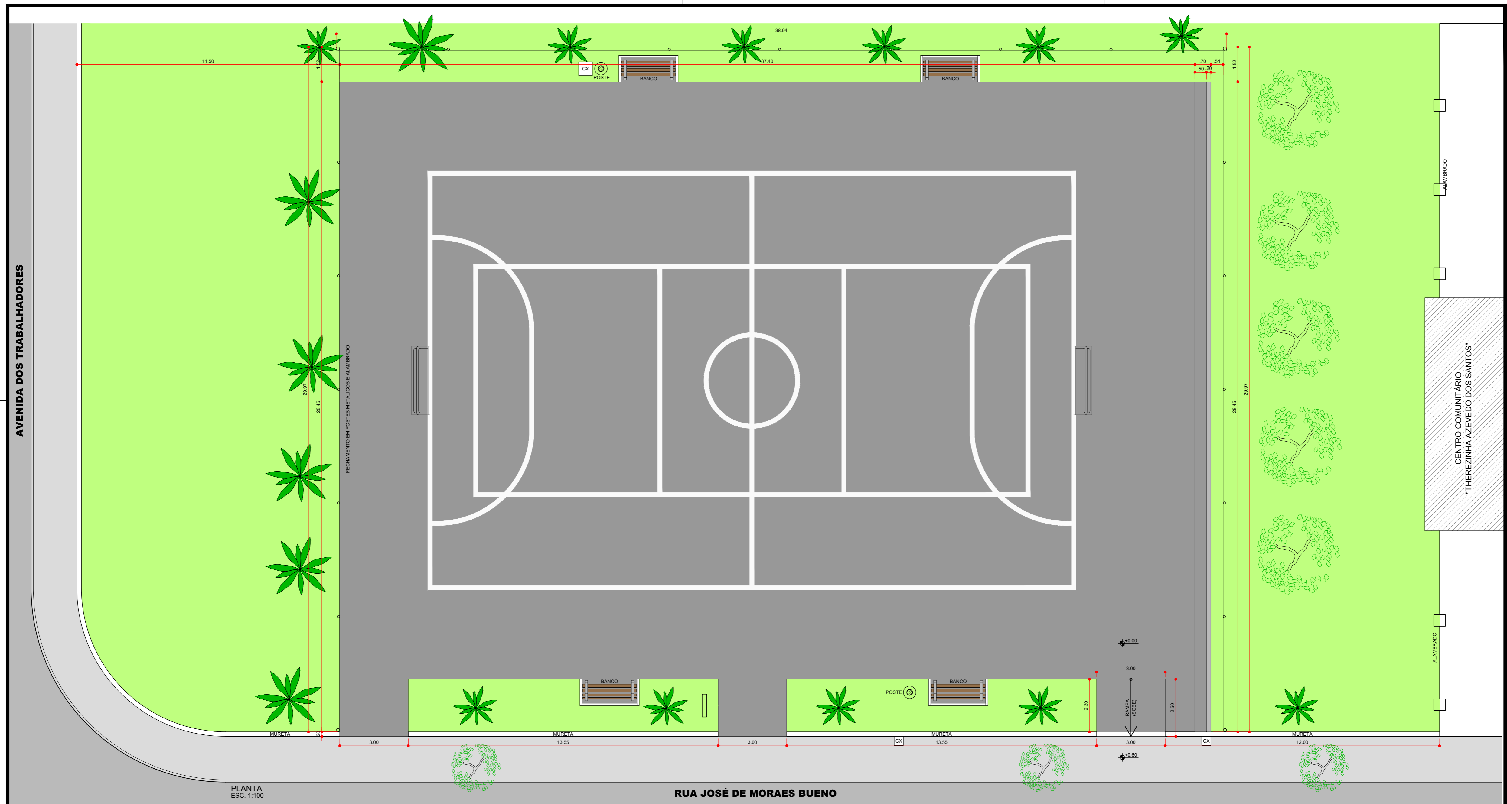
PLANTA ESC. 1:100