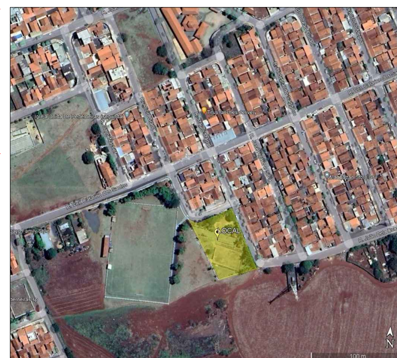
LOCALIZAÇÃO S/ ESCALA