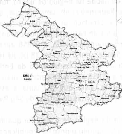
Rede Regional de Atenção à Saúde - RRAS 09 e respectivos DRS, Regiões de Saúde e Municípios.