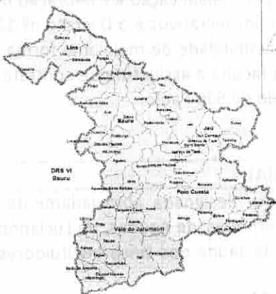
Rede Regional de Atenção à Saúde - RRAS 09 e respectivos DRS, Regiões de Saúde e Municípios.