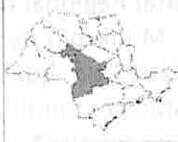
Estado de São Paulo - DRS - RRAS 09